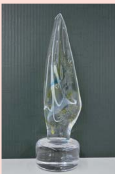
(上)感謝状/(下)記念品