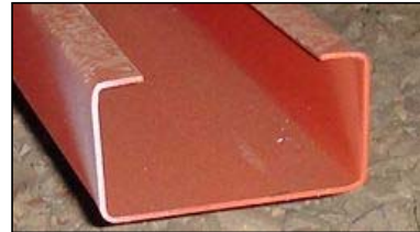
カラーリップ溝形鋼