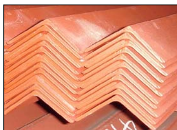
カラー山形鋼も取扱しております